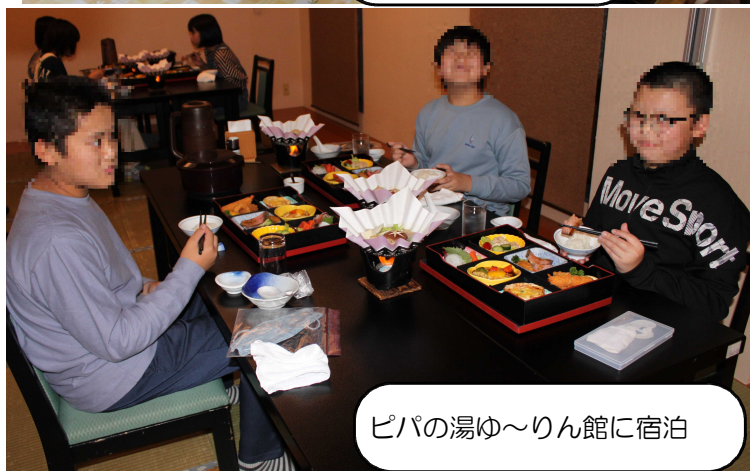
ピパの湯ゆ〜りん館に宿泊