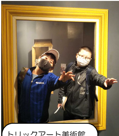
トリックアート美術館