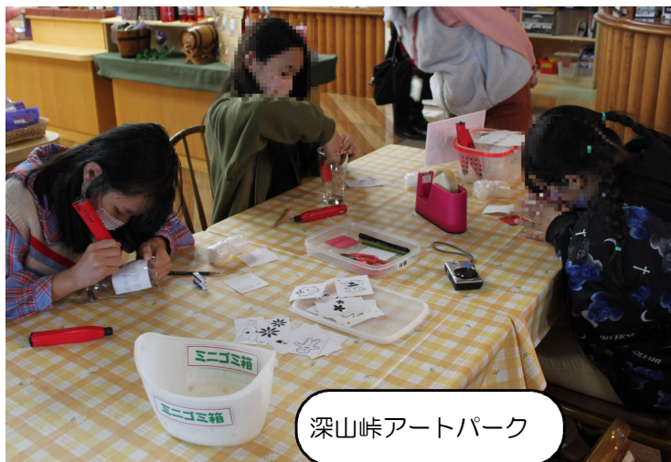
深山峠アートパーク