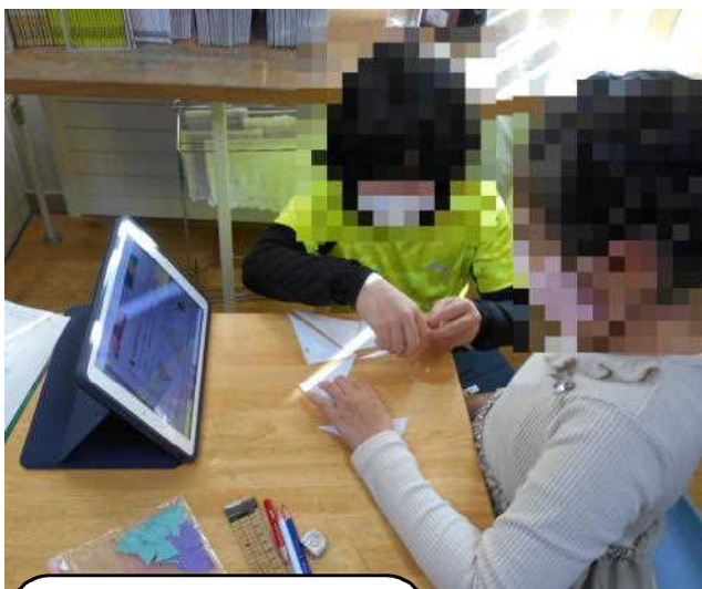
3年生は算数。三角形を敷き詰めた模様づくりについて学習しました。