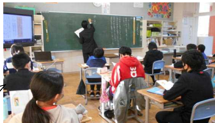
6年生は国語。時と場所、相手に応じた敬語の使い方について学習しました。