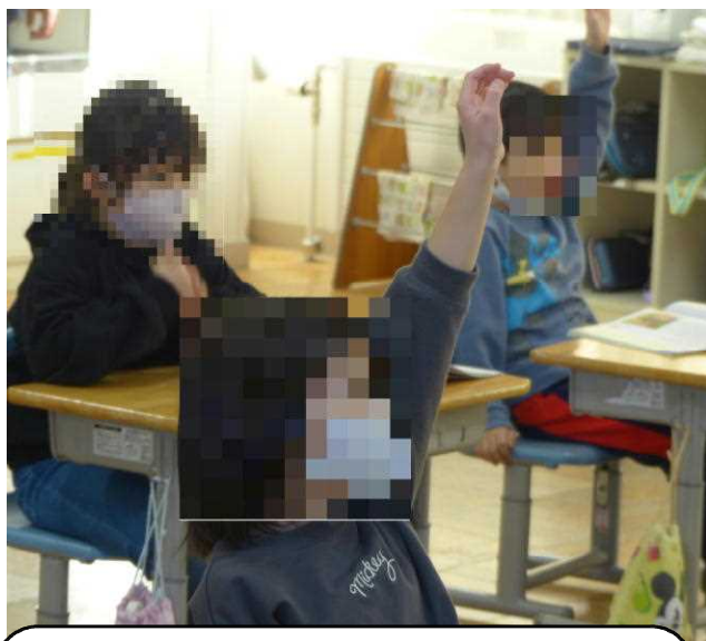
1年生は道徳。「もりのゆうびん屋さん」で、働くことのよさについて考えました。