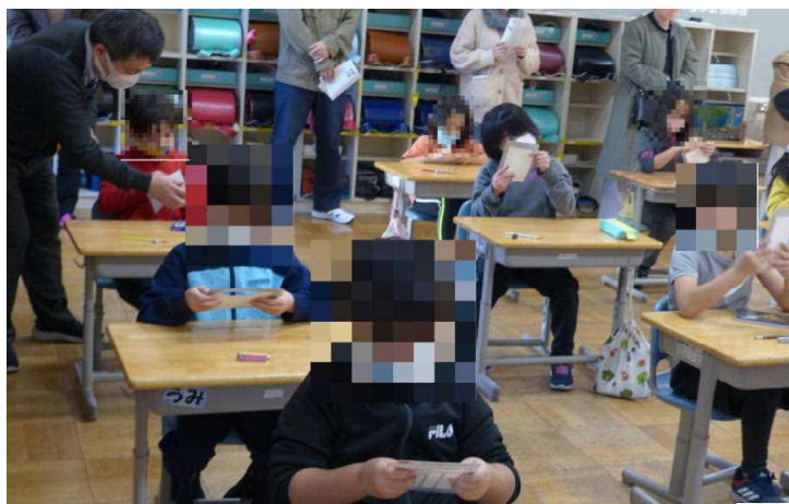
2年生は書写。年賀状の書き方について学習しました。