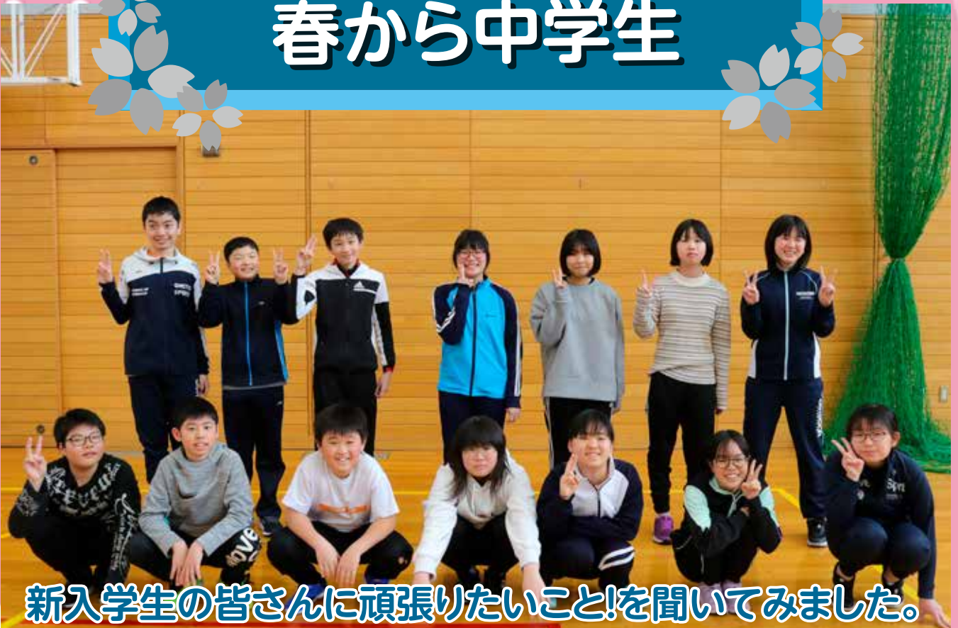
新入学生の皆さんに頑張りたいこと!を聞いてみました。