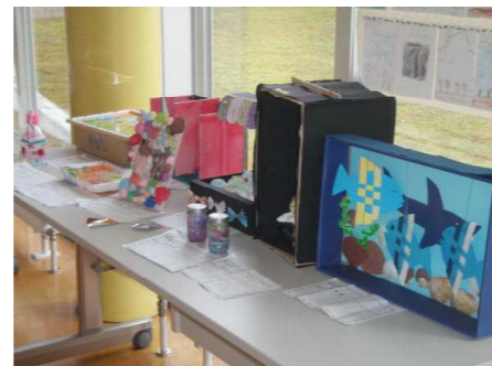
【自由研究・工作の様子】