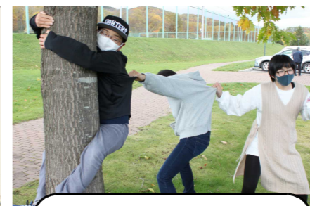
どんなシチュエーション？