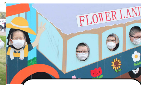
観光地の定番！めがね4兄弟！