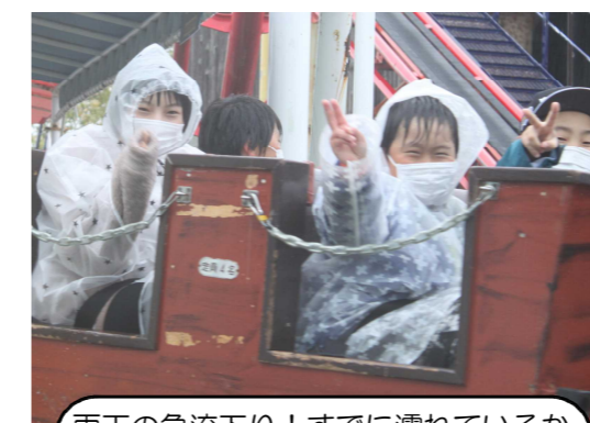
雨天の急流下り！すでに濡れているから大丈夫？