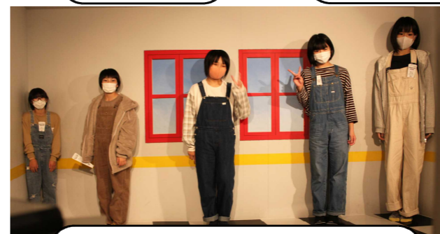
トリックアート！誰が一番背が高い？