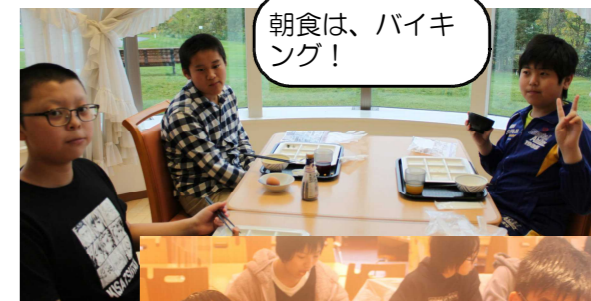
朝食は、バイキング！