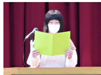
困ったことがあったら声をかけてください！