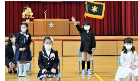
名前を呼ばれて元気に「ハイ！」