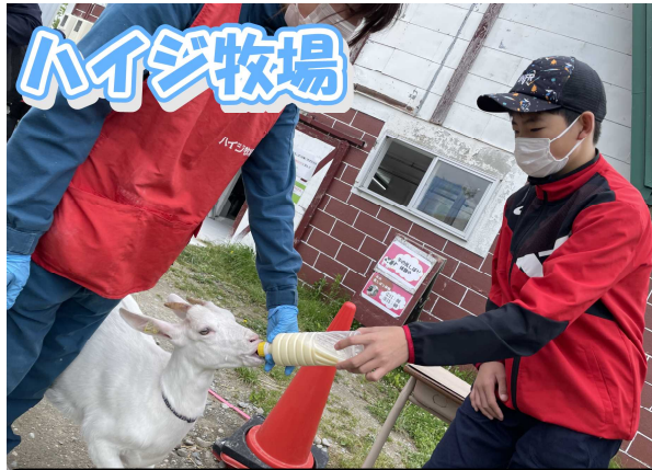
ハイジ牧場 哺乳体験、ウールクラフト、たくさんの動物とふれあいました。

6月23日(木)24日(金)に1泊2日で、6年生17名が最も楽しみにしていた修学旅行に行ってきました。行き先は、コロナウイルスの感染を考慮して岩見沢方面と登別方面で見学・体験・宿泊をしました。後半は雨天となり、当初の計画を変更したところもありましたが、6年生全員が思いっきり楽しみ、最高の思い出をつくった2日間になりました。