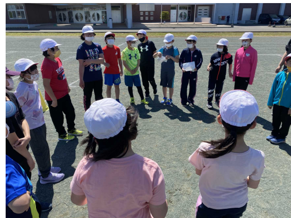
【作戦タイムの様子（3・4年生）】

「三人寄れば文殊の知恵」の言葉もある通り、一人では上手くできない、どうしてよいかわからないことがあっても話し合いを通して解決の方法を探っていく。このことは、運動会だけでなく日常の学習をはじめ、学校生活全般でとても大切なことです。さらに、この「話し合い」を通して、自分や相手のよさを知ることにもつながります。この素晴らしい成果を今後の教育活動にも広げていきます。