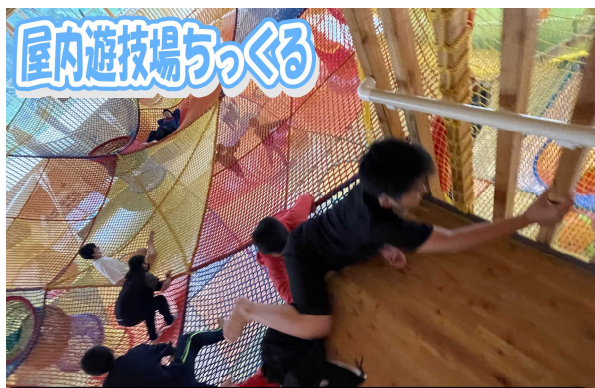
屋内遊技場ちっくる 幼少にもどって、みんな元気にはしゃぎました。本当に楽しそうでした。