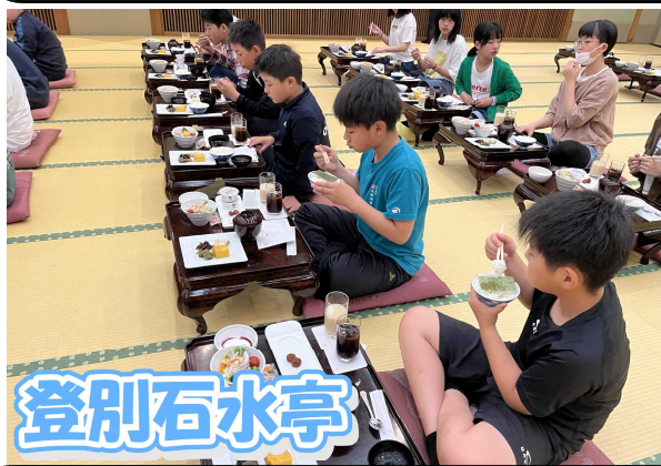
登別石水亭 おいしい食事と気持ちのよい温泉で疲れを癒やしました。いろんな種類のお土産がありました。