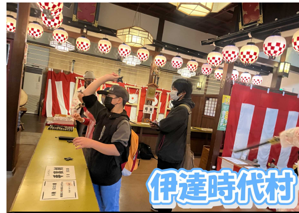
伊達時代村 忍者屋敷や手裏剣などの忍者体験、江戸時代にタイムスリップ、買い物を楽しみました。