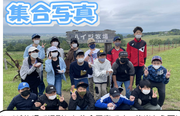
集合写真 ハイジ牧場で撮影した集合写真です。後半から雨に当たってしまいましたが、そんなことも気にならないくらい、楽しい思い出ができました。