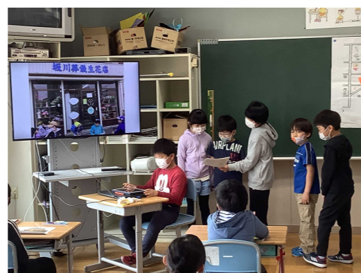
【3年生の「町探検発表会」】

学習面では、「楽しく学び、分かる喜び」を実感できる授業を目指してきました。iPadなどICTも活用しながら、子どもたちが興味・関心をもって主体的に学ぶ授業の在り方を研究主題に据えて取り組んでいます。そのため、新型コロナウイルス感染症の状況に留意しながら、水産業見学や農業体験をはじめ、水泳授業などについても今年度から復活させ、子どもたちの五感を重視した教育活動を進めています。また、コロナ学力の個人差の解消に向けて「朝学習や通常の授業における少人数指導の強化」、「支援員の効果的な配置」、「家庭学習の工夫」を行い、授業改善を図っています。普段の授業評価や北海道で取り組んでいるチャレンジテストなどの結果なども踏まえながら、一つ一つ改善を重ね、子どもたちに確かな学力を育めるよう、努力していきます。