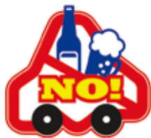
←飲酒運転根絶ロゴマーク

飲酒運転の根絶に関する理解・関心を深め、北海道全体で飲酒運転を根絶するための取組を実施します。