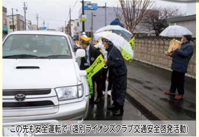
この先も安全運転で (遠別ライオンズクラブ交通安全啓発活動)