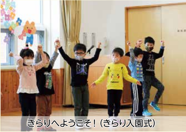
きらりへようこそ! (きらり入園式)