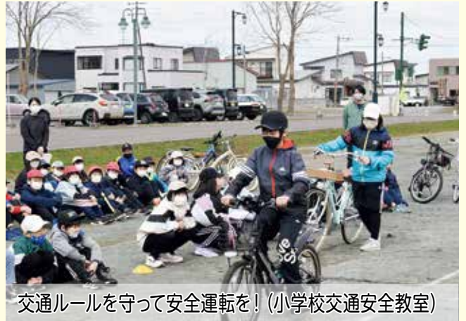
交通ルールを守って安全運転を! (小学校交通安全教室)