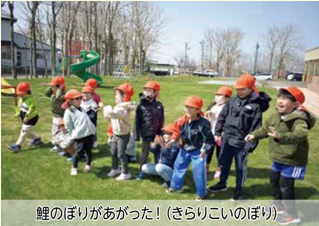
鯉のぼりがあがった! (きらりこいのぼり)