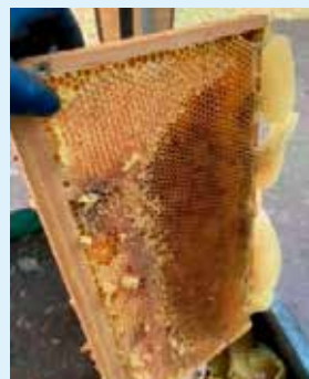
蜜蓋がかかった巣枠