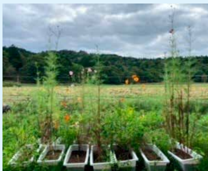
成長したコスモス

右の写真はイベントで作ったたねだんごのプランターです。全体の写真で少し見えづらいですが、コスモスがぐんと大きくなって、背の高さくらいまでになりました。キバナコスモスとピンク色のコスモスの種がありましたが、両方ともしっかり咲いています。ヘアリーベッチは時期を過ぎたので少しづつ枯れてきました。開花時期がずれて長い間咲いてくれると蜂も嬉しいですね。