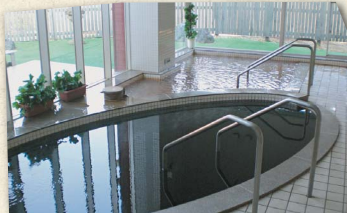
ナトリウム—炭酸水素塩・塩化物質(低張性アルカリ性高温泉)

黒い色が特徴で、古い角質を取り除きお肌をなめらかにします。感触がすべすべして女性におすすめの「美肌の湯」です。