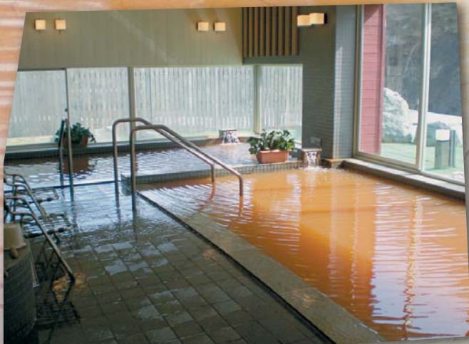
ナトリウム—塩化物質(低張性中性高温泉)

赤茶色が特徴で、肌に付着した塩分が汗の蒸発を防ぎ、湯上りの湯冷めがしにくく保温効果があります。