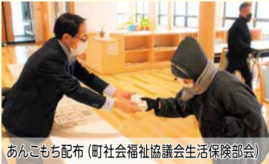
あんこもち配布 (町社会福祉協議会生活保険部会)