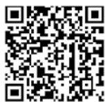
政策ページQRコード

※マイナポータルを通じて転出届の提出をした後は、別途、転入先市区町村の窓口で転入届の手続が必要です。