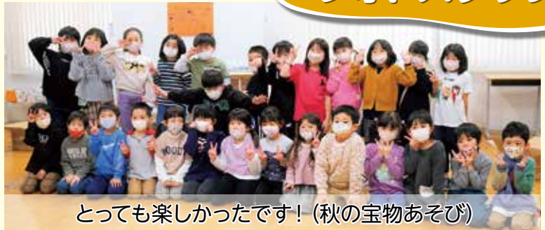
とっても楽しかったです! (秋の宝物あそび)