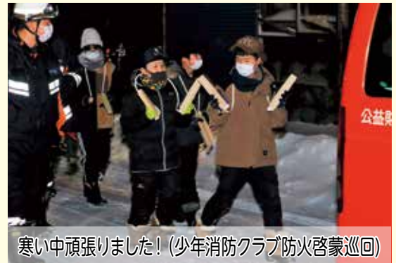
寒い中頑張りました! (少年消防クラブ防火啓蒙巡回)