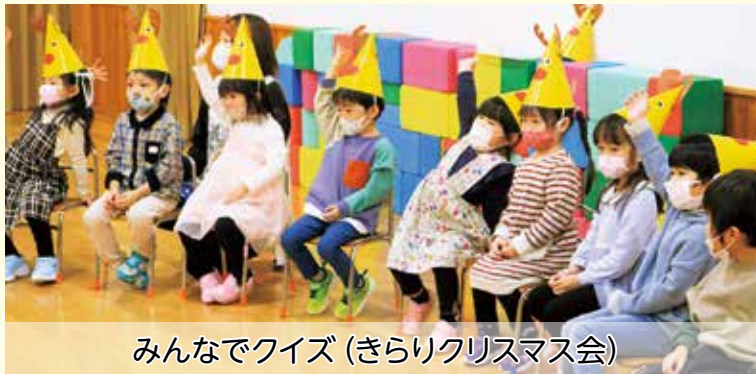
みんなでクイズ (きらりクリスマス会)