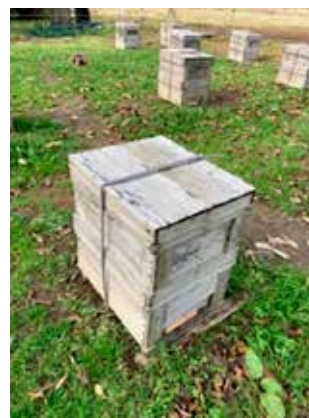
しっかり荷締めした巣箱、これで移動させても大丈夫。