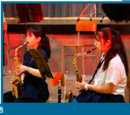
吹奏楽 演奏曲『小さな恋のうた』他