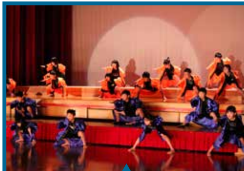
3年生 『よさこいソーラン』