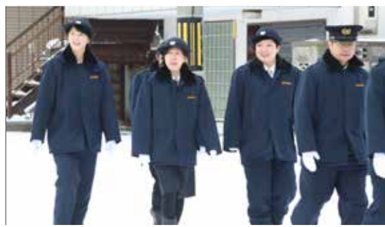
出初め式の際の活動写真