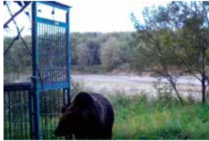
久光に設置した罾に近づくヒグマ

いところであれば、目撃情報をもとに定点カメラを設置しつつ、箱罾でも許可を得たうえで設置、捕獲の準備をしている。