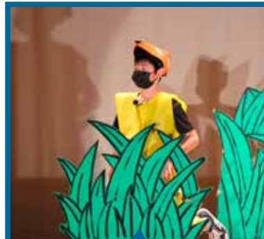
4年生 演劇 『ごんぎつね』