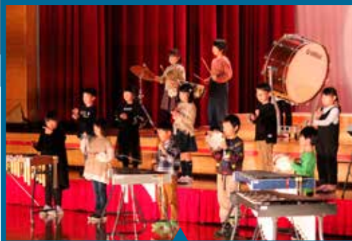
1年生 器楽合奏 『おもちゃのチャチャチャ』『きらきらぼし』