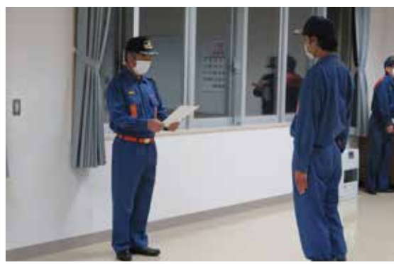
新消防団員入団時の様子