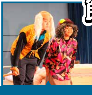
演劇 帰ってきた遠別新喜劇『安静にしまショー!』