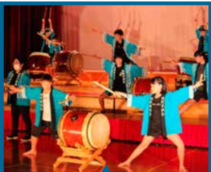
5年生 『樹遠太鼓～三宅～』