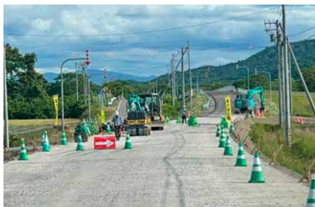
奥島橋架け替えに伴う舗装工事

定土工が予定され、奥島橋におきましては、架け替えに伴う舗装工事が予定をされております。