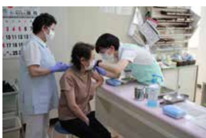
新型コロナウイルス ワクチン接種の様子

なっております。65歳以上の高齢者の2回の接種につきましては、7月末までに希望者全員の接種を完了する予定であります。12歳以上の町内の対象者2,321名に対する6月10日までの接種率につきましては、約30%となっております。今後の予定といたしましては、国からのワクチン供給が安定していかないため非常に流動的ではありますが、次の優先順位となっております。基礎疾患のある方、高齢者施設等の従事者、60歳から64歳までの方及びそれ以外の一般の方につきましては、順次接種開始を目指して準備・調整を行っているところであります。