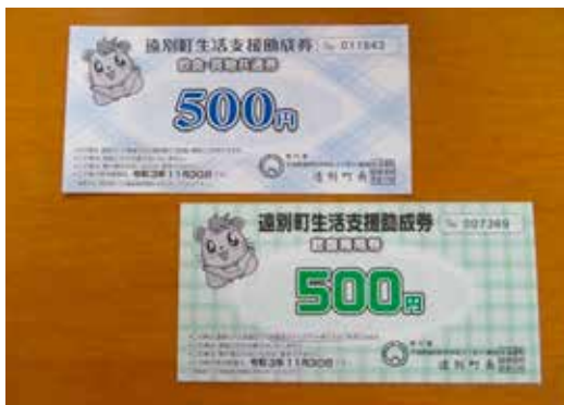
5月下旬に町内に配付された生活支援助成券

おり、収束にはまだ時間がかかるものと思われる。収束までに数か月要した場合に、どのような経済対策を考えているのか伺う。