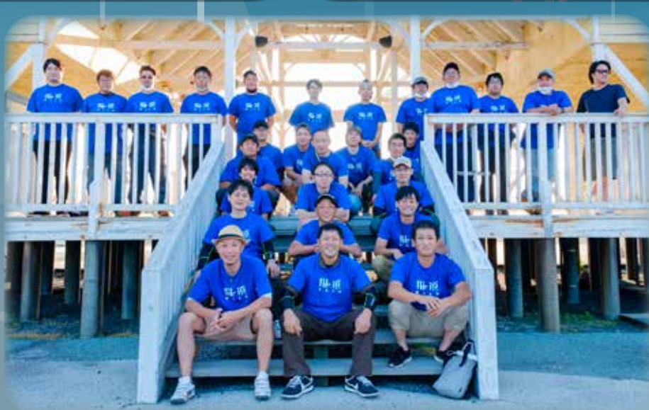
当日集まった和遠メンバー