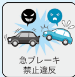
急ブレーキ 禁止違反