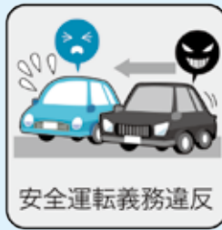
安全運転義務違反