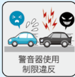
警音器使用 制限違反