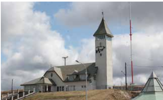
とんがりかん（4月24日撮影）

補修を含めた有効な活用方法について、内部でも検討し、町民の皆様、議員各位とともに、知恵をいただきながら進めていきたいと考えているので、ご理解のほどお願いする。最後に、道の駅の機能を担ってきた、とんがりかんに代わり、新たな道の駅えんべつ富士見についても、より町民の皆様を始め、多くの皆様に愛される施設運営に努めますのでよろしくご愛顧のほどお願い申し上げます。