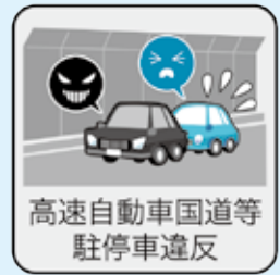
高速自動車国道等 駐停車違反