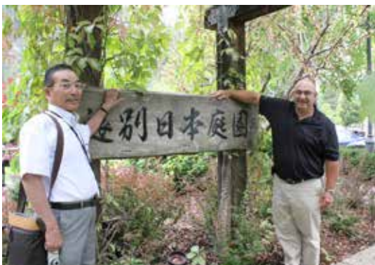
令和元年度キャッスルガー市表敬訪問

今後も市・交流事業関係者と連携を図り、引き続き事業を進めていきたいと考えている。