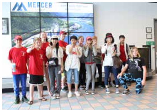
令和元年度青少年相互交流事業