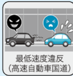
最低速度違反 (高速自動車国道)