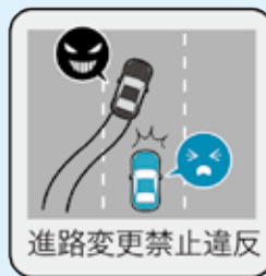
進路変更禁止違反