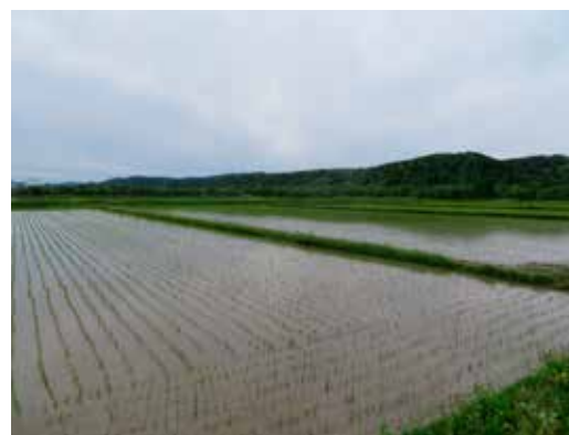
5/29 撮影 (久光地区 水田)

2点目の質問について、現在のホームページの内容を見直し、質問にあるような新しい情報を盛り込む等、記事の構成についても魅力あるものとなるように検討を重ねていきたいと思う。また、昨年の7月にオロロン農業協同組合、そして、留萌振興局、羽幌町、初山別村、遠別町で構成する「オロロン地区農業担い手確保対策協議会」が設立され、各関係機関が一丸となつて担い手確保対策をとり進めているところである。地域の農業を守るために何としても、これについてはしっかりと進めていきたいというふうに考えているので、ご理解いただきたい。