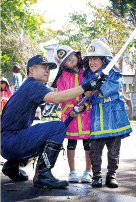
冷たい〜! (きらり放水体験)