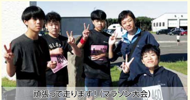
頑張ってます! (マラソン大会)