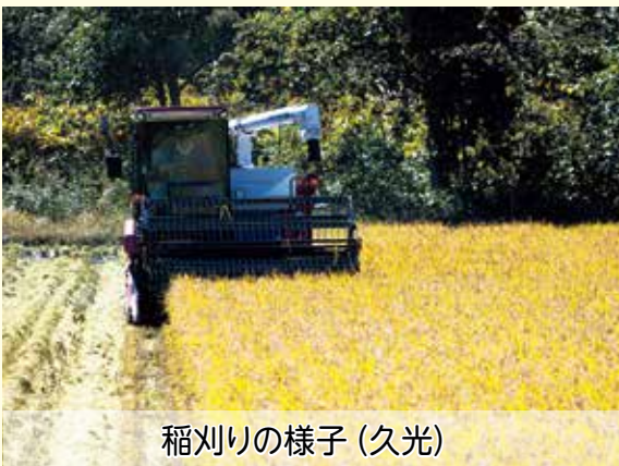
稲刈りの様子 (久光)