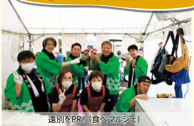
遠別をPR! (食べマルシェ)