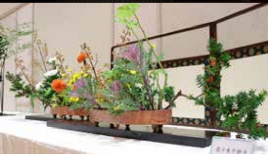
作品展示「いけばな小原流」