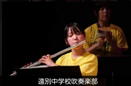
遠別中学校吹奏楽部