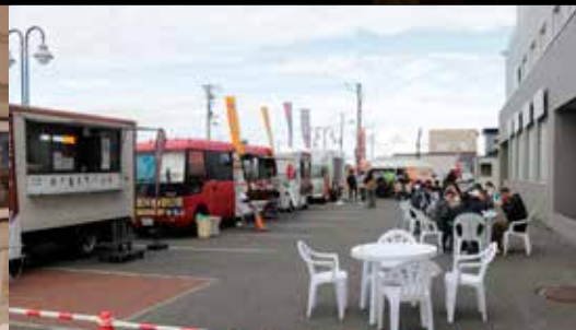
キッチンカーフェス