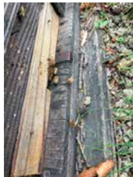
←入口を狭く。 冷たい空気が入りづらくします。

越冬期は気温も低いので、反応から外に出るまで時間がかかりますが、2月中旬くらいからは気温が高くなる日も出てきて、光に敏感に反応します。覆いをめくったらうわーっと巣門から蜂が出てくるようになってきて、ものすごく慌てます。日中は暖かい日もあるとはいえ、倉庫内では太陽も直接見られないので一度巣箱から出たら戻れなくなり、夜間の冷え込みで蜜蜂が死んでしまいます。少しでも多くの蜂を残すために素早く！冬に気をつけるのは、素早く観察、異常には早く気づくように、と心掛けています。