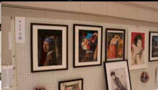
作品展示「アイリス会」