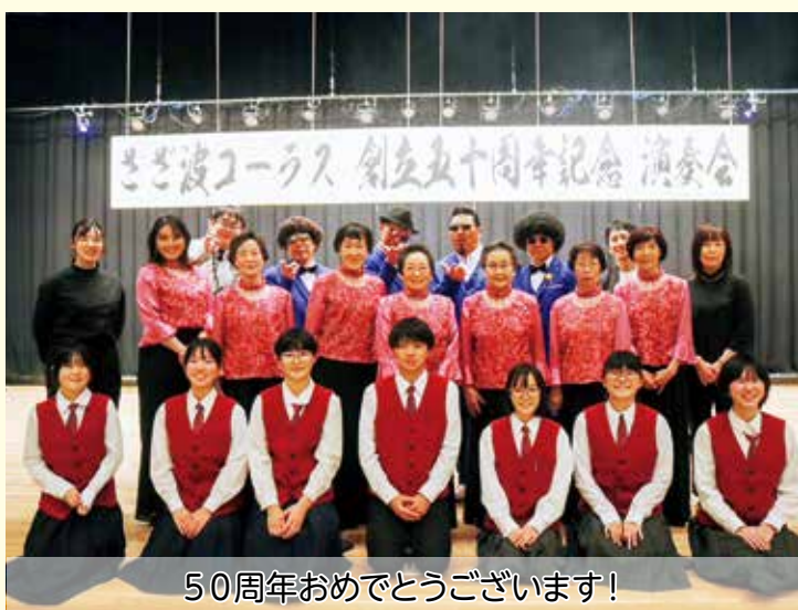
50周年おめでとうございます!