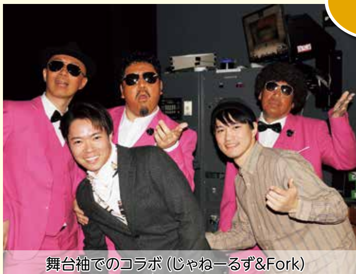
舞台袖でのコラボ (じゃねーるず&Fork)