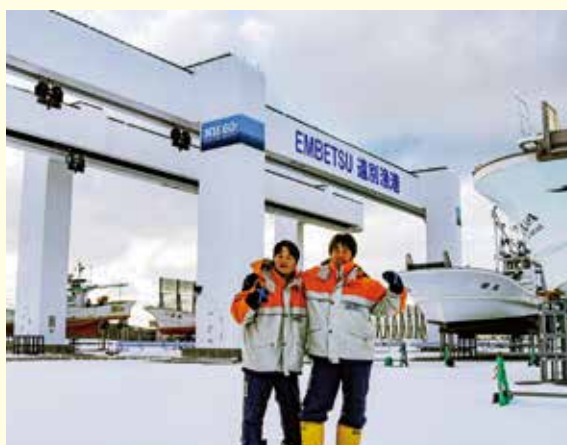
また遠別に来てね! (聖隷クリストファー高校)