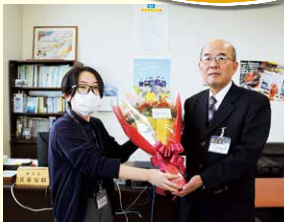
約6年間お疲れさまでした! (教育長退任)