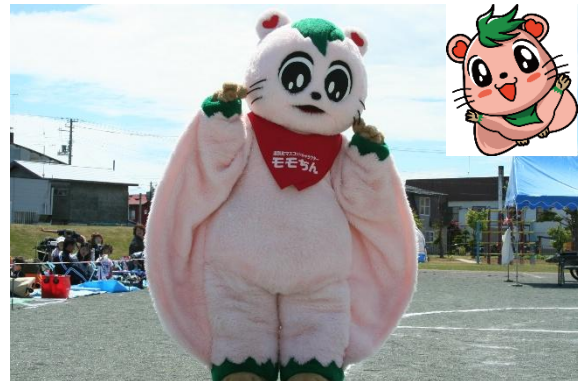
町マスコットキャラクター モモちゃん