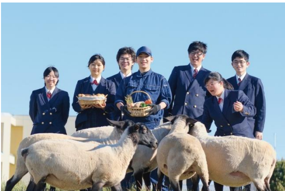
北海道遠別農業高等学校