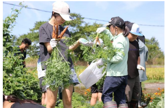
町教育事業「子どもチャレンジ教室」