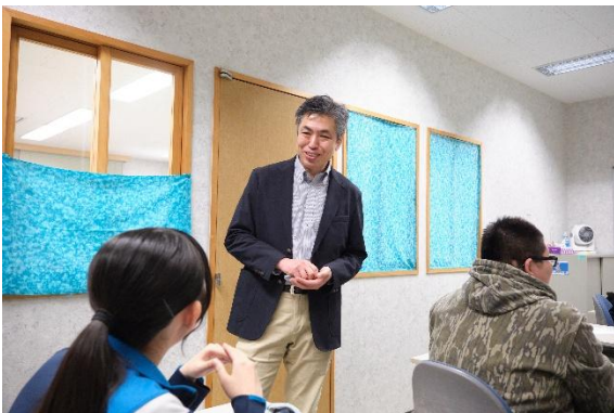
公設民営塾「えんべつ学びの場」