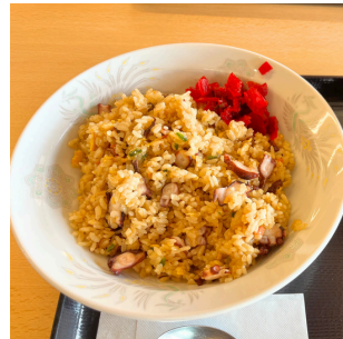
たこチャーハン 1,000円