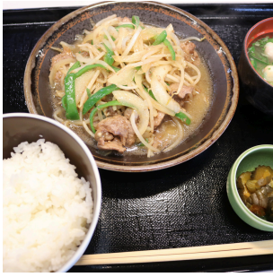
ジンギスカン定食 1,300円