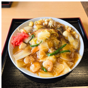
海鮮 あんかけ焼きそば (丼にもできます) 1,100円