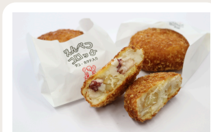
えんべつコロッケ 350円