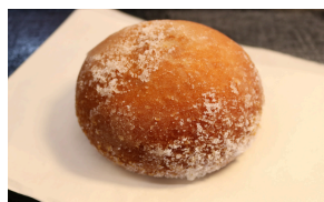
あんドーナツ カレーパン 400円