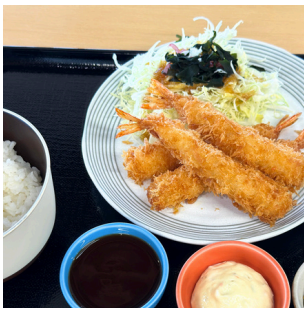
エビフライ定食 1,200円