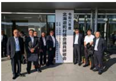
全道町村議会議員研修会

温暖化による1次産業の影響や、地方自治体の重要性を再認識でき、大変参考になる研修会となりました。