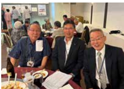
札幌ふるさと遠別会

新型コロナウイルス感染拡大防止により4年間の休会を経ての開催ともあり、遠別町を想い、ふる里を大切にする気持ちがとても強く感じられ、遠別町の昔話や近況などの話で盛り上がりました。